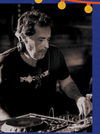
Figure incontournable de la scène électronique, Manuel Perez est un pionnier de la culture club entre Méditerranée et Scandinavie. DJ professionnel depuis 1986 s'étant produit dans des dizaines de pays, il est aussi à l'origine de centaines de productions discographiques et de réalisations dans le domaine des arts graphiques.